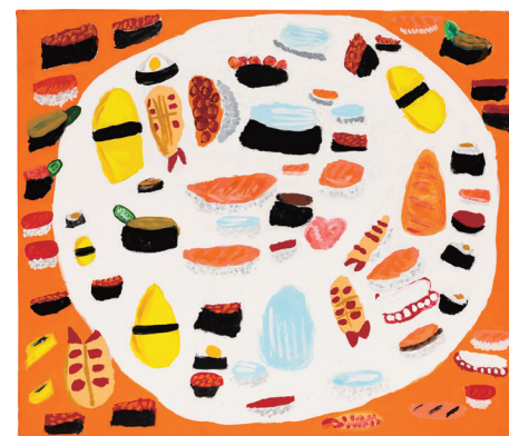
山本美和(お寿司のパラエティパック)2020年 様々な種類のお寿司が白いお皿に収まりきらないほどにたくさん描かれた作品。お寿司へのほとばしる情熱を朗らかな色彩と確かな描写力で表現している