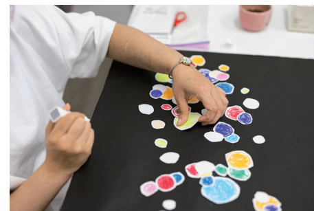
様々な表現手法を積極的に取り入れてきた吉岡さつきさん (上)ロックやクラシックなどの音楽を聴きながらこんこんと湧きだす創作アイデアを即興的に表現した作品。同シリーズのキャラクターを縫いぐるみにした立体作品もある (下)様々な色を黒い画面上に散らばせてそのリズムミカルな動きを楽しみながら制作