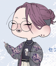
センターマスコット まみちゃん

障がい者の芸術・文化活動に関する必要な情報を収集し、インターネット等を活用して、広く発信するよ。